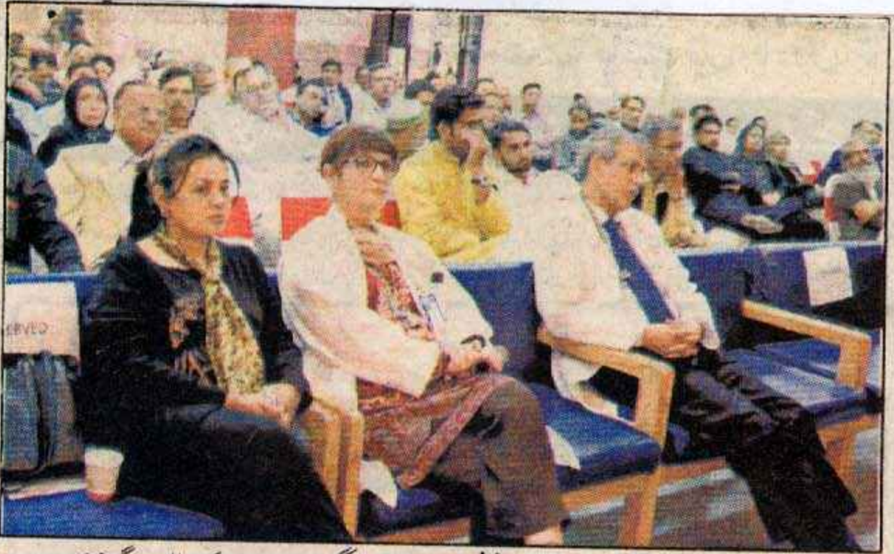
اسلام آباد گردوں کی صحت کے حوالے سے شفا انٹرنیشنل میں منعقدہ آگہی سیمینار میں ڈاکٹر طلباء و دیگر شریک ہیں