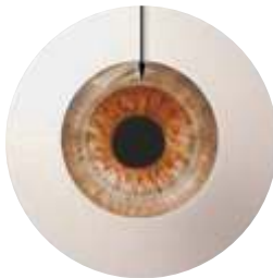
Corneal button removed